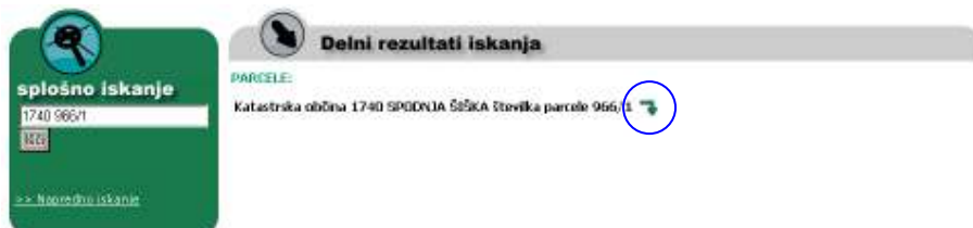
Slika 4: Delni rezultati iskanja preko parcele, na kateri stoji stavba