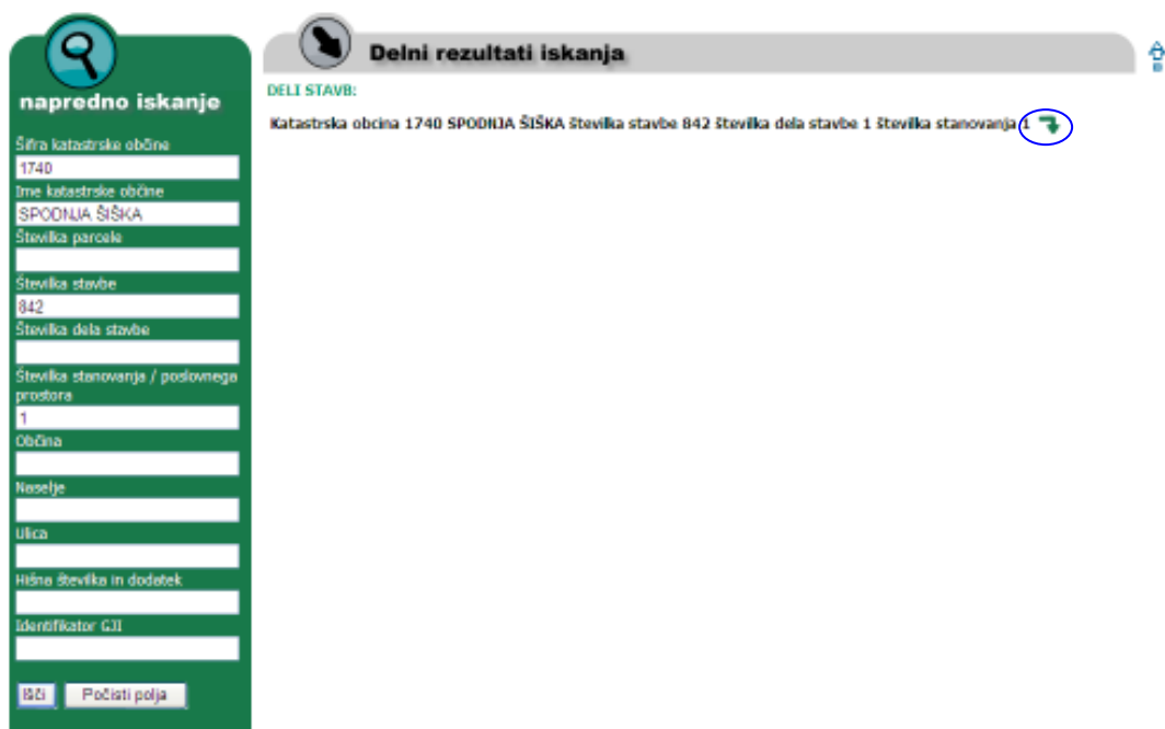
Slika 8: Delni rezultati iskanja preko šifre katastrske občine, številke stavbe in številke stanovanja/poslovnega prostora