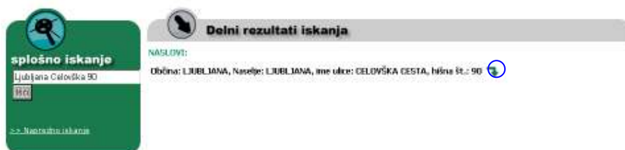
Slika 2: Delni rezultati iskanja preko naslova stavbe