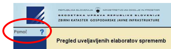
Slika 5: Navodila za vsak modul.

Enaka navodila so dostopna tudi iz vsakega modula.