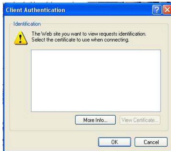
Slika 6: Opozorilno okno.

POSTA-CA ali HALCOM. V primeru, da na računalniku uporabnik nima nobenega spletnega potrdila, se pri prijavi pojavi naslednje okno: